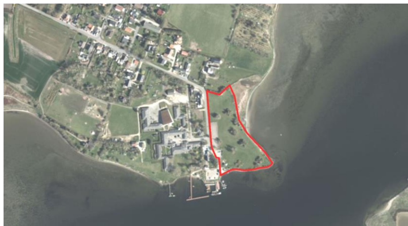
Kommuneplanrammens beliggenhed ved Klintebjerg havn.

Tillæg nr. 1 medfører ingen væsentlige ændringer i kommuneplanens hovedstruktur og er ikke i strid med planens hovedprincipper.