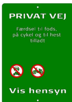
Godkendt skilt fra Naturstyrelsen