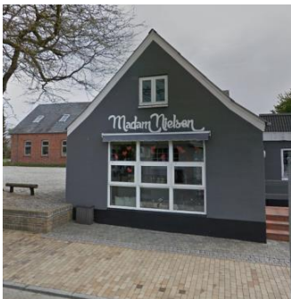
Eksempel på facadeskilt, malet direkte på gavlfacade mod vei.

Bebyggelse i byzone eller samlet bebyggelse i landzone