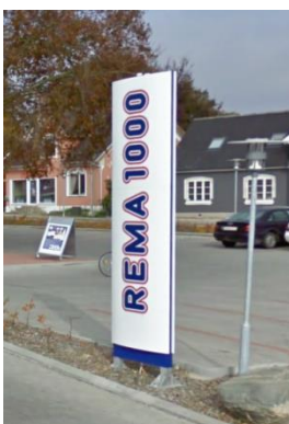
Eksempel på pylon ved indkørsel