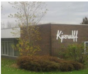
Eksempel på facade-skilt i erhvervsområde