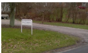
Eksempel på mindre oplysningskilte ved indkørsel

Du må placere dit skilt ved de røde punkter.