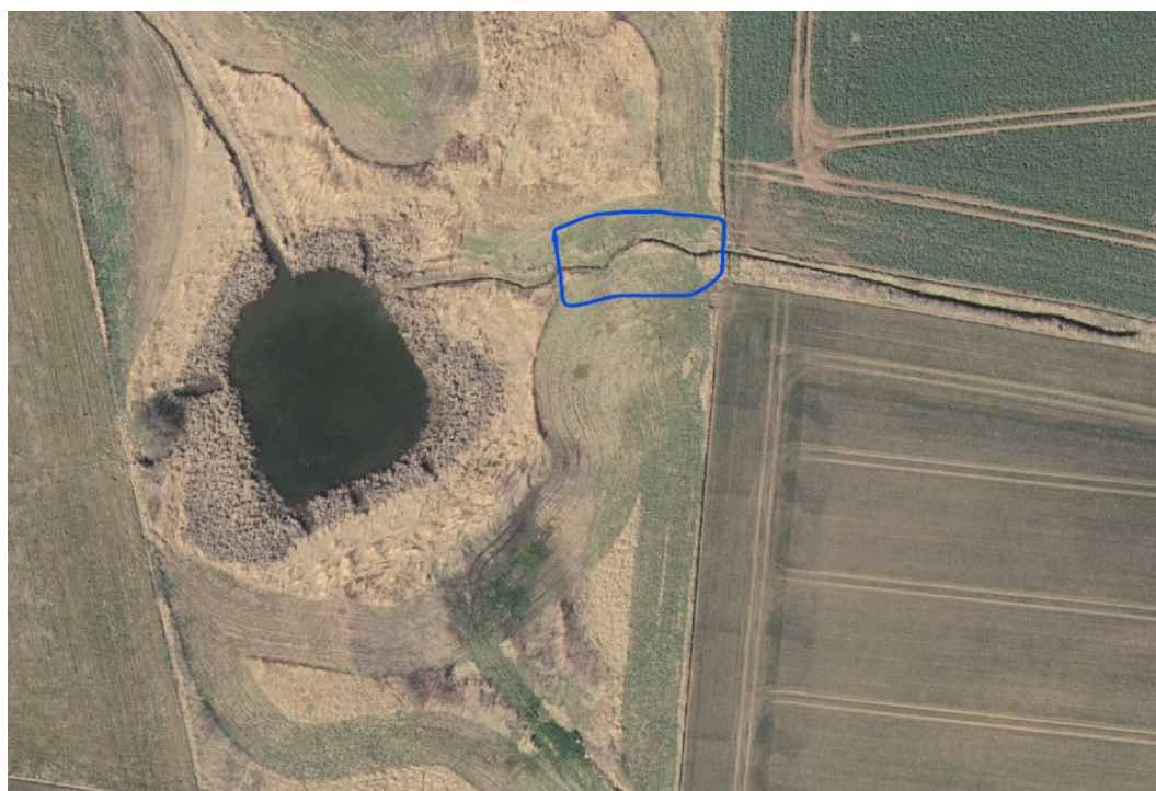
Figur 2. Ortofoto over Jullerup-Ejlby Afløbet. Blå indtegning indikerer sandfangets placering.

Etablering af sandfanget vil fremadrettet forhindre søen i at sande til og dermed gavne vandløbets økologiske tilstand, herunder levevilkårene for fisk, smådyr og den akvatiske vegetation.