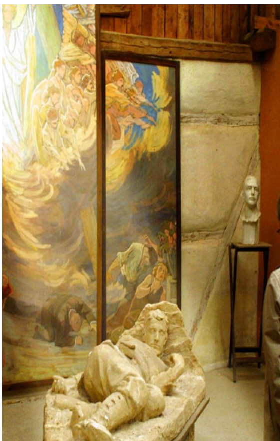
Skitse-museum ved Hofmansgave

Visionen skal opnås ved at arbejde med de indsatsområder, der er beskrevet nedenunder.