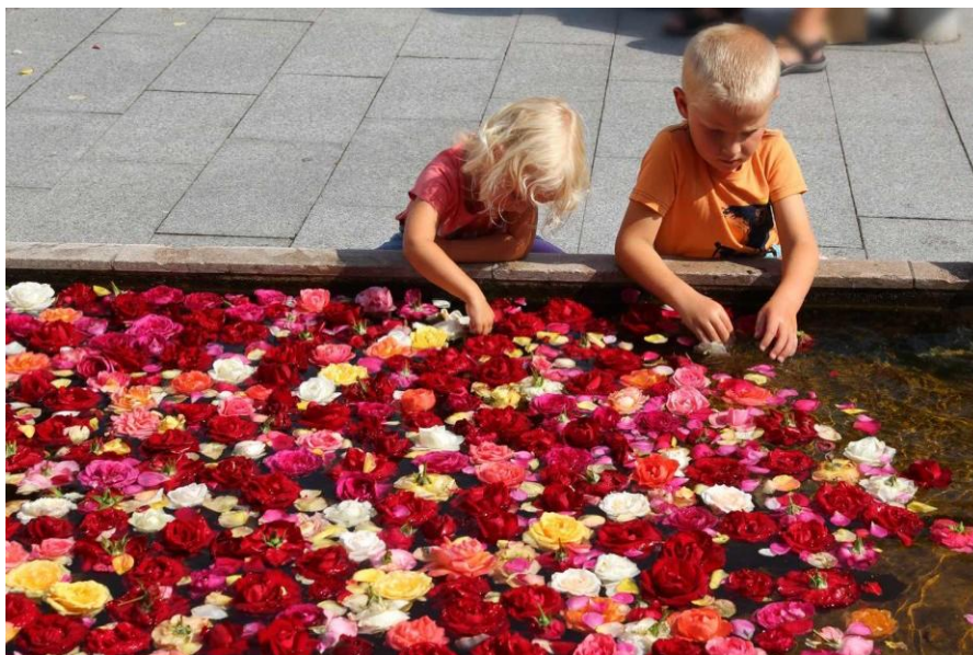
Rosenfestival i Bogense

Gennem et stærkt samarbejde kan aktiviteterne formidles bedre gennem en koordineret indsats. En fælles formidling af aktiviteterne skaber på sigt en fælles nordfynsk identitet, der er grobund for udviklingen ikke kun af kultur- og fritidslivet, men også turismeindsatsen og erhvervslivet.