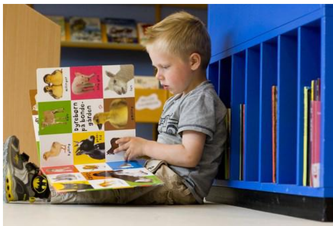
På et bibliotek kan man ikke kun læse bøger

Nordfyns Kommune er allerede medlem af Film Fyn. Der skal fremover gøres en særlig indsats for filmproduktioner i kommunen. Vi hjælper produktionsselskaberne hurtigere og mere smidigt igennem det offentlige system, der skal søges godkendelser, tilladelser, arbejdskraft mv.