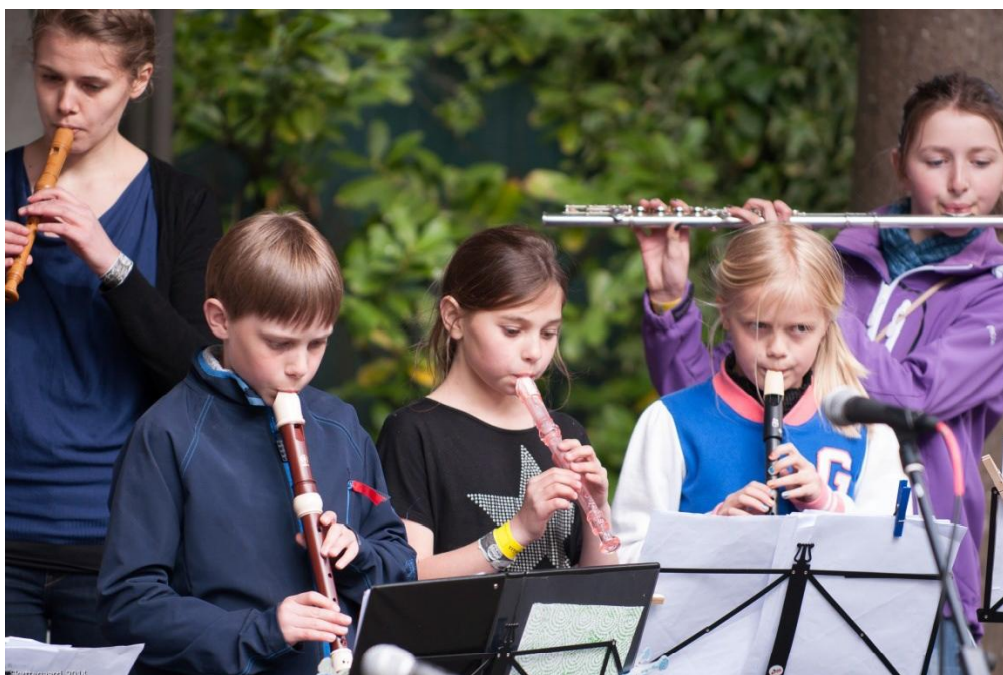
Musikskoleelever og deres lærer viser deres kunnen

Med skolereformen bliver der skabt muligheden for at inddrage det lokale kultur- og fritidsmiljø i skolen. Skolerne skal åbne sig for det samfund, der omgiver dem ved at inddrage idrætsforeninger, kulturinstitutioner, biblioteket, musik- og kulturskoler, museer og andre lokale foreninger. Nordfyns Kommune vil gerne sikre, at børn og unge får gode muligheder for at møde samfundet og især kultur- og fritidslivet.