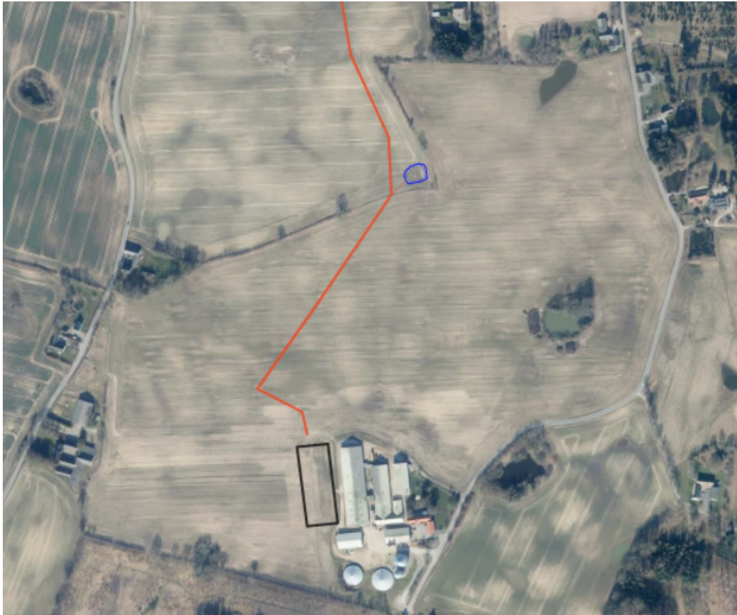
Figur 2: Den nye stalbygning er angivet med sort omrids. Tagvand fra stalbygningen ledes i rørledningen (orange streg) mod åen. Regnvandsbassinet er angivet med blåt omrids. Fra en brønd på rørledningen til bassinet anlægges en ledning, der fører vand ind i bassinet ved megen regn.

Udformning og placeringen af regnvandsbassinet fremgår på figur 3 nedenfor. Søen placeres ca. 10 meter fra skel og levende hegn. Ansøger ejer alle de tilstødende marker.