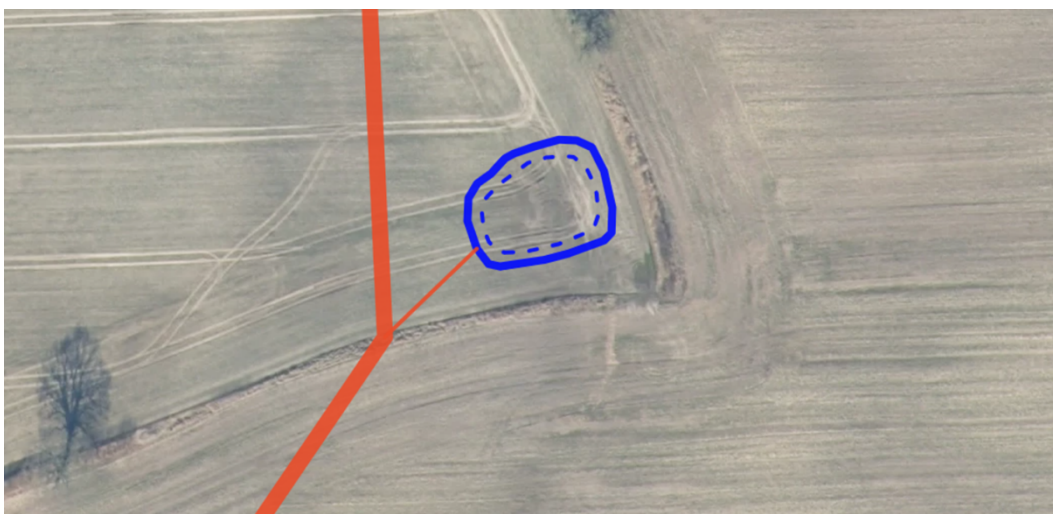
Figur 3: Fuldt optrukket, blåt omrids angiver søens totale areal, mens den stiplede linje angivet det omtrentlige permanente vådvolumens vandspejl (50 % af totalvolumen).

Udformning og placeringen af regnvandsbassinet fremgår på figur 3 nedenfor. Søen placeres ca. 10 meter fra skel og levende hegn. Ansøger ejer alle de tilstødende marker.