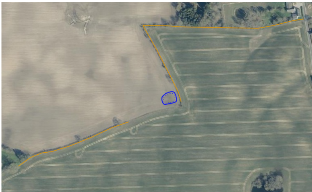
Figur 4: Beskyttede jorddiger er angivet med gul streg. Bassinet er angivet med blåt omrids.

Den opgravede jord må ikke udspreddes inden for 2 meter af nærliggende beskyttede diger. Se digerne på figur 4 nedenfor.