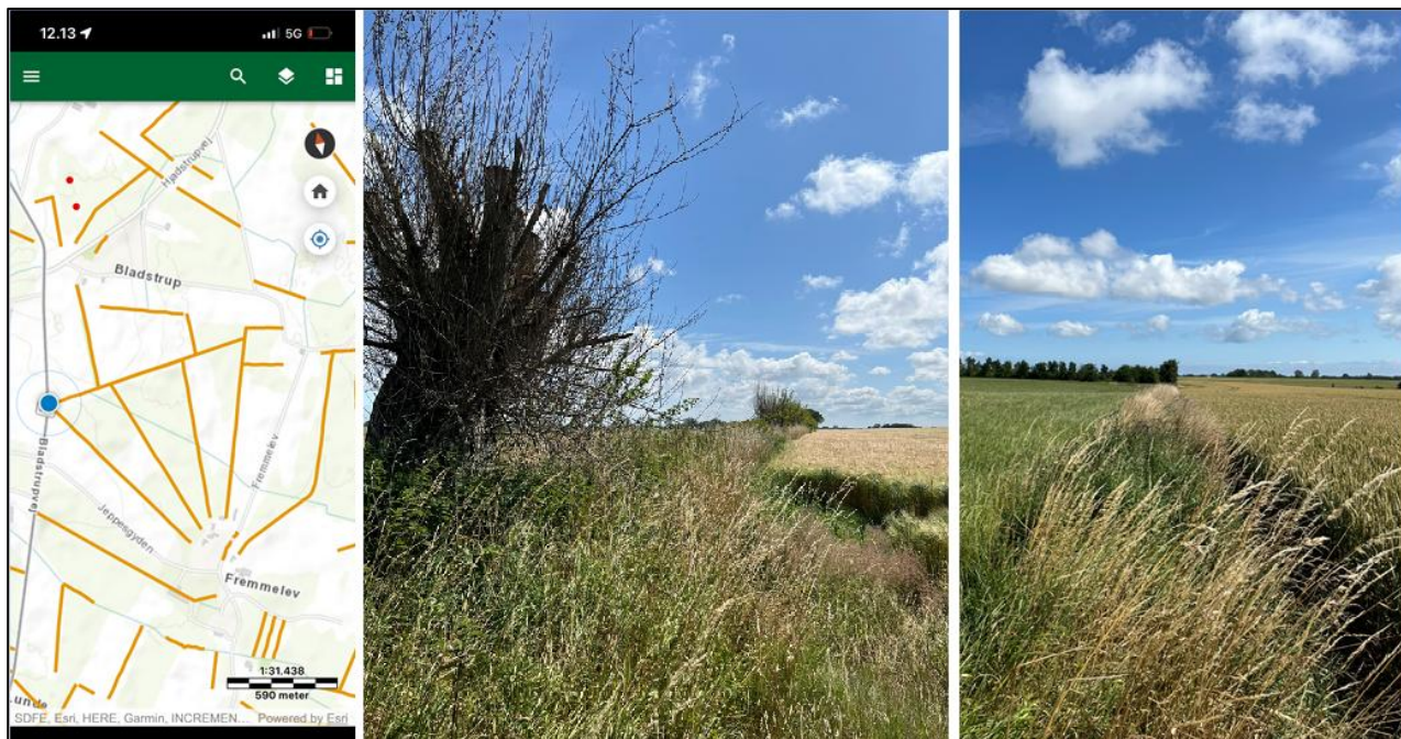
Billede 3 viser nærliggende dige til det fjernede dige

Det fjernede dige, D00.034.167, indgik som en del af et stjerneformet system af diger. I besigtigelsen kørte vi længere nordpå til næste dige i stjerneformationen. På denne lokation kunne der tydeligt i det flade landskab se digerne stikke op i det flade landskab. Udover, at digerne i stjerneformationen i Fremmelev By har en høj kulturhistorisk værdi, vurderes der at, det nedlagte dige og digerne omkring også har en landskabelig værdi som giver struktur i landskabet.