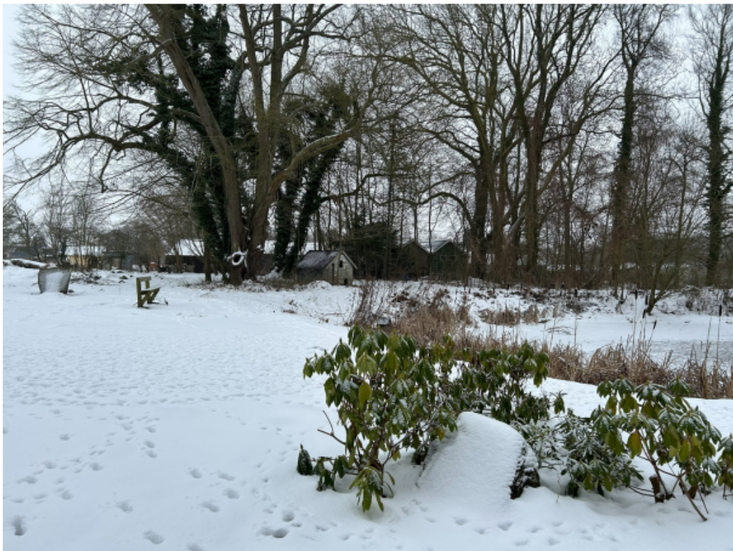
Figur 2 Nordlig del af sø, hvor der skal etableres hegn inden for skovbyggelinjen.

Skoven er en del af parkområdet ved Østruplund, og består af forskelligaldrede løvtræer. Fredskovsarealet er ca. 3,1 ha. I den østlige del af skov- og parkarealet ligger to søer beskyttet efter naturbeskyttelseslovens § 3. Mellem skovbrynet og den vestligste af de to søer (gul streg på figur 4), løber en sti, der forbinder øvrige stier i parkområdet, og giver adgang fra Østrup by. Skoven kan ses tilbage på luftfoto fra 1945 og de lave målebordsblade (1901-1971).