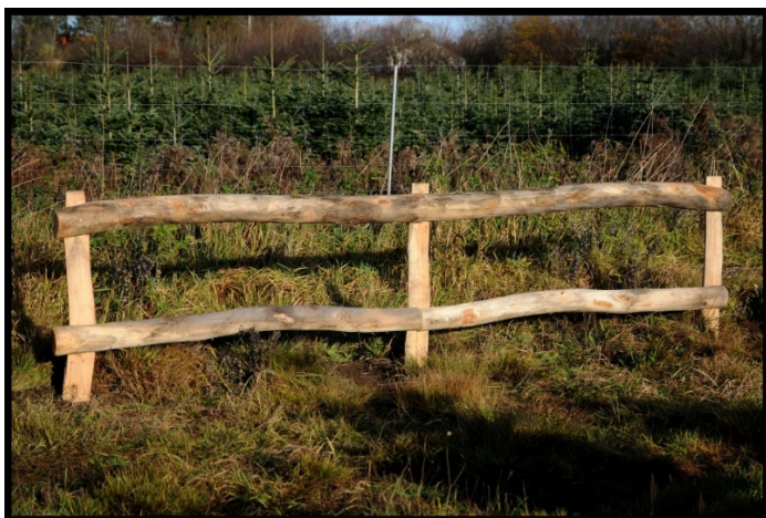
Figur 5 Eksempel på det ansøgte hegn.

Ansøger har anført, at der ønskes et hegn af træ med træstolper og to tværgående rafter, som falder naturligt ind i omgivelserne, med en øvre højde på 110 cm. Det anføres desuden, at der er ønske om, at alle dyr fortsat kan passere hegnet. Nedenfor på figur 5, ses eksempel på et hegn, der er medsendt i ansøgningen.