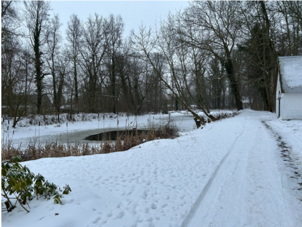
Figur 3 Billede taget fra nord mod syd. Stien der løber ad den gule streg på figur 4.

Formålet med hegnet er et sikkerhedshensyn for at lede færdsel ad stien og forhindre, at beboere og besøgende færdes tættere på søen end selve stien.