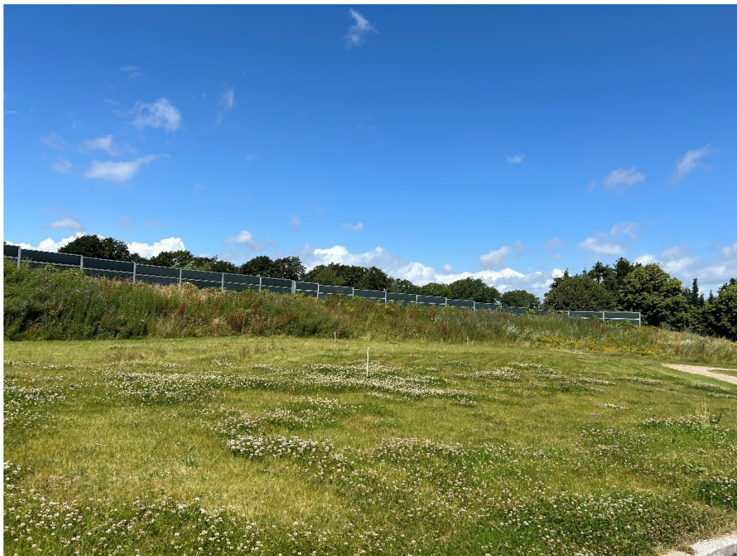
Billede 5 Billede taget fra øst mod vest på indersiden af støjvolden. Terrænet er højere på den østlige side af støjvolden.

Fra Åbakkevænget i øst mod Søndersøvej i vest, se billede 5 og 6: Terrænet er højere inden for støjvolden (øst og syd for) end uden for (vest og nord for), hvilket gør at selve støjvolden ikke er nær så høj, og at støjskærmen oven på volden er mere fremtrædende.