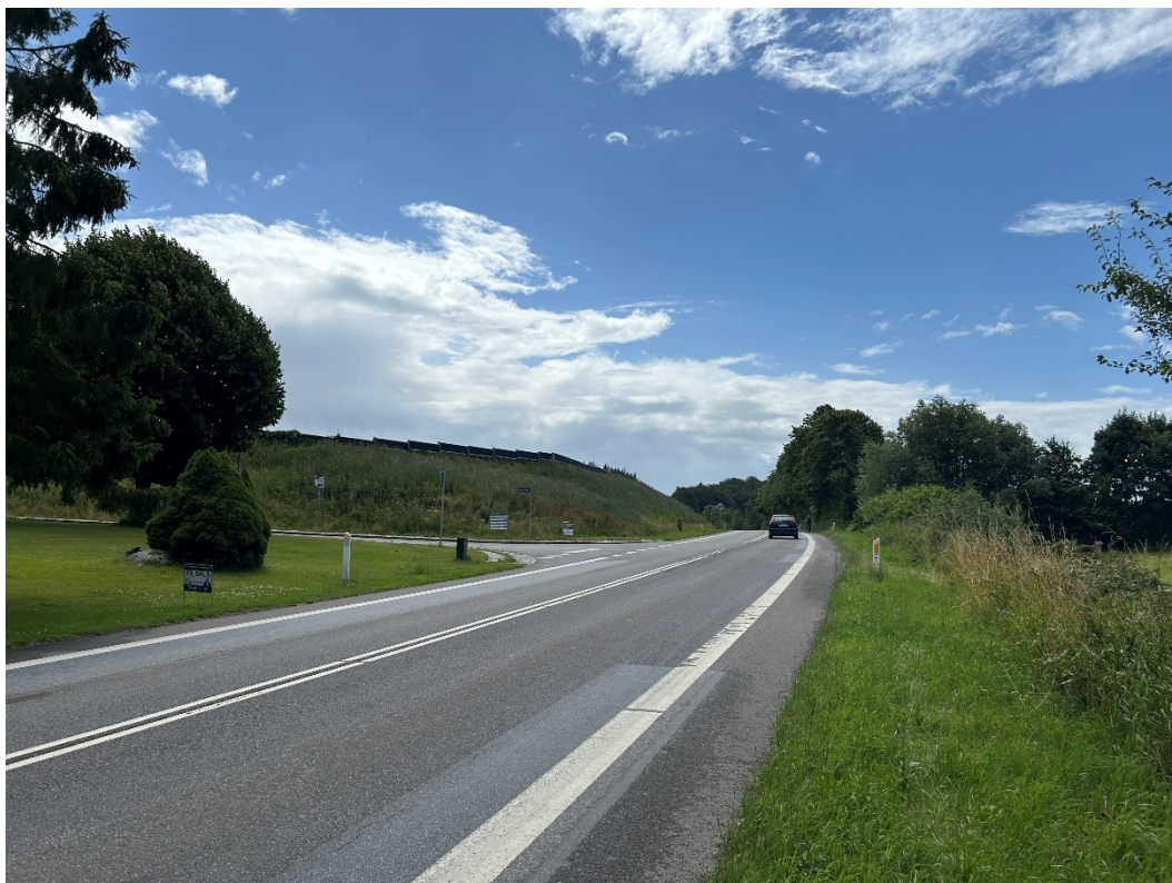
Billede 4 Støjvolden set fra nord mod syd. Her er støjvold og støjskærm mere fremtrædende.