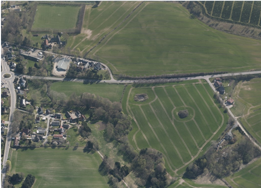
Billede 1 Skråfoto fra 2019