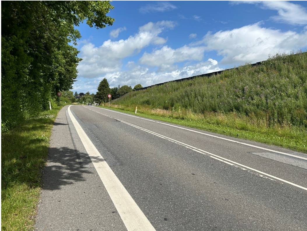
Billede 2 Billede taget fra syd mod nord ad Søndersøvej. Støjvolden hæver sig mod øst, og her kan støj-skærmen også ses.

Fra rundkørslen Søndersøvej/Rugårdsvej i nord mod støjvolden i syd, se billede 3 og 4: Søndersøvej drejer en smule mod øst lige omkring Åbakkevej, hvor støjvolden er placeret på hjørnet af Søndersøvej og Åbakkevej. Når man bevæger sig fra nord mod syd, bemærkes stigningen og det levende hegn i vestsiden først på grund af det lille højresving. Nærmere støjvolden bliver volden mere fremtrædende, idet der ikke er træer eller et levende hegn foran, som det er tilfældet på vestsiden. Støjskærmen ses tydeligt på toppen af volden.