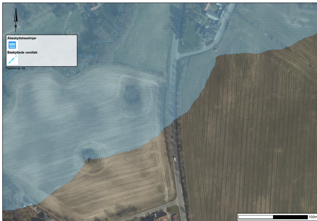
Figur 2 Luftfoto fra 2020. Støjvolden er endnu ikke etableret. I stedet løber et levende hegn langs den østlige side af Søndersøvej

Inden støjvolden blev etableret var der et levende hegn på strækningen. Støjvolden er anlagt ved at hæve skråningen i en vold bag træærkkens tracé. Træerne er i forbindelse med etablering blevet fjernet. Støjvolden følger således vejens forløb og bøjer i den nordlige ende ind mod boligområdet.