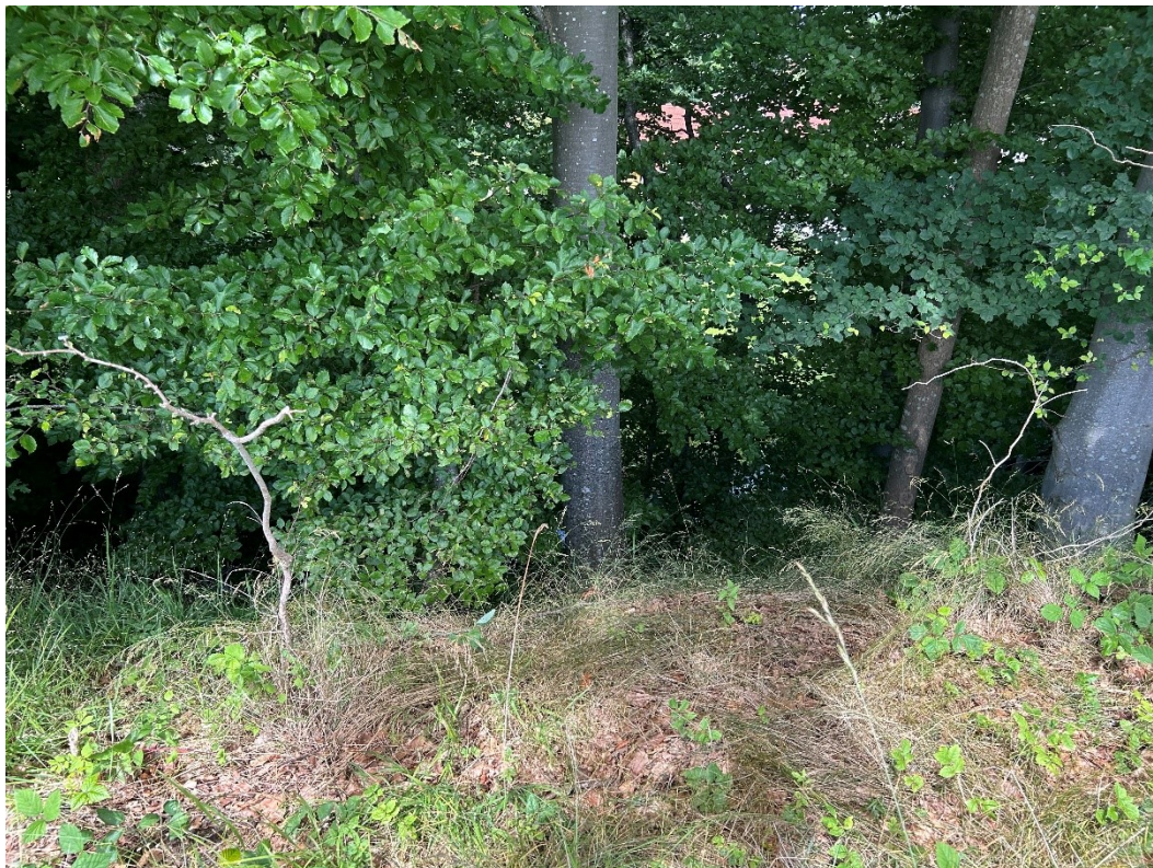
Billede 7 Stejl skrænt ned mod Stavids Å. På skrænten vokser træer og buske.

Fra Stavids Å i vest mod Søndersøvej i øst, se billede 7, 8 og 9: Stavids Å ligger i kote 31-33, hvor brinken er en stejl skrænt med et kuperet terræn oven for åen i kote 37-40. På skrænten ned mod åen står træer og buske i forskellige aldre og højde. På grund af det kuperede terræn er indtrykket af støjvolden meget forskellig. Mod nord, hvor terrænet er højere, er støjvolden mere fremtrædende end længere mod syd, hvor koten er lavere. Her kan man kun ane støjskærmen oven på volden.