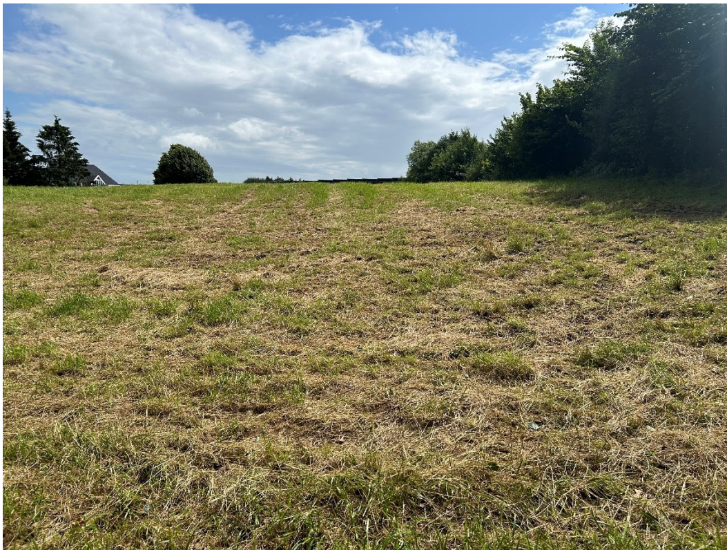
Billede 9 Billede taget fra vest mod øst. På grund af kuperet terræn kan støjvolden ikke ses. Støjskærmen kan lige anes hen over toppen af bakken.