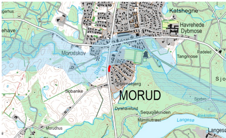
Figur 1: Oversigtskort over området, samt angivelse af støjvoldens og -skærmens placering med rød linje.

Støjvolden og støjskærmen er beliggende mellem Åbakkevænget og Søndersøvej syd for Morud. Se nedenstående kort.