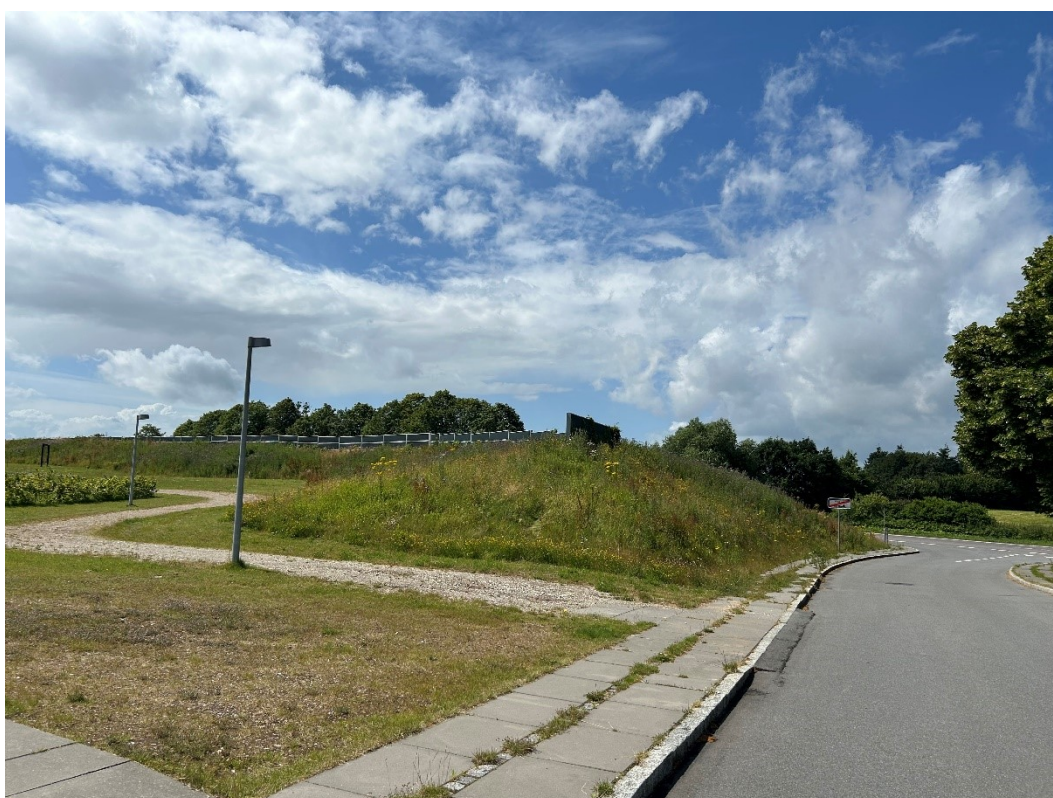
Billede 6 Billede taget fra øst mod vest.