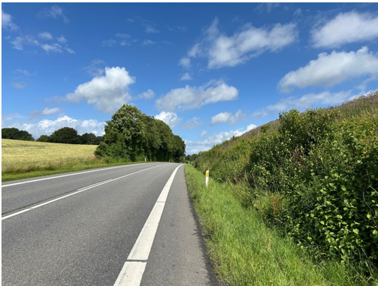
Billede 1 Billede taget fra syd mod nord ad Søndersøvej. Støjvolden hæver sig mod øst, hvor et kuperet terræn og levende hegn hæver sig vest for vejen.

Fra Elverodsvej i syd mod Åbakkevej i nord, se billede 1 og 2: Støjvolden rejser sig meget stejlt øst for Søndersøvej, ca. fra kote 38,5 til 43-44. Vest for Søndersøvej står et levende hegn. Terrænet bag ved det levende hegn stiger stejlt, på scalgø er det målt til at være fra ca. kote 38,5 til kote 43. Dette giver fornemmelse af, at vejen er gravet igennem en bakke. Støjskærmen oven på støjvolden er ikke fremtrædende på grund af højden på volden og vegetationen.