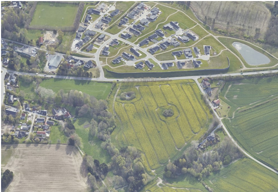
Billede 2 Skråfoto fra 2023