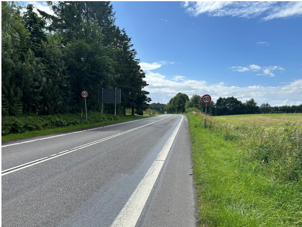
Billede 3 Støjvolden set fra nord mod syd. På afstand ses det levende hegn og stigningen i terrænet på den vestlige side og Søndersøvej tydeligere.