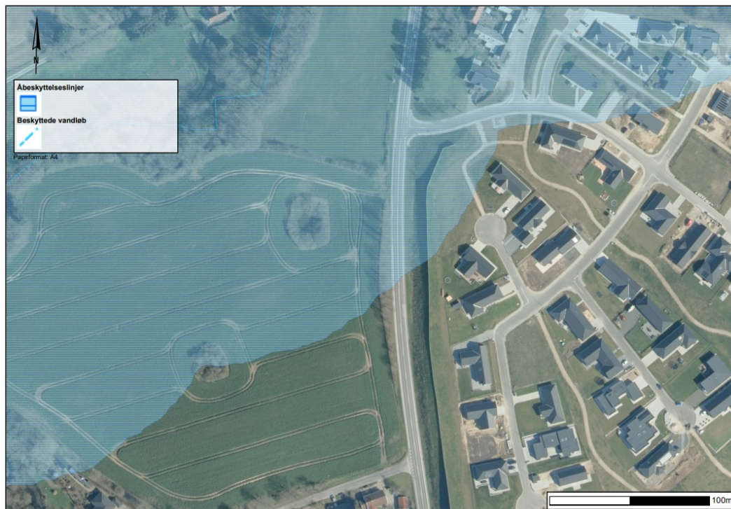
Figur 3 Luftfoto fra 2023. Støjvolden er etableret og bagved er de fleste udstykninger bebygget.

Hele støjvolden er ca. 350 m lang og ligger langs med Søndersøvej i nord-sydgående retning. Ud af de ca. 350 m er ca. 95 m af støjvolden inden for åbeskyttelseslinjen. Afstanden fra Stavids Å til støjvolden er ca. 116 m. Bredden på støjvolden er ca. 18 m og højden er ca. 2,5 m med en 1 m høj støjskærm ovenpå, i forhold til det tidligere terræn. Støjvolden er dermed etableret som en forhøjning af en eksisterende skråning ned mod vejen.