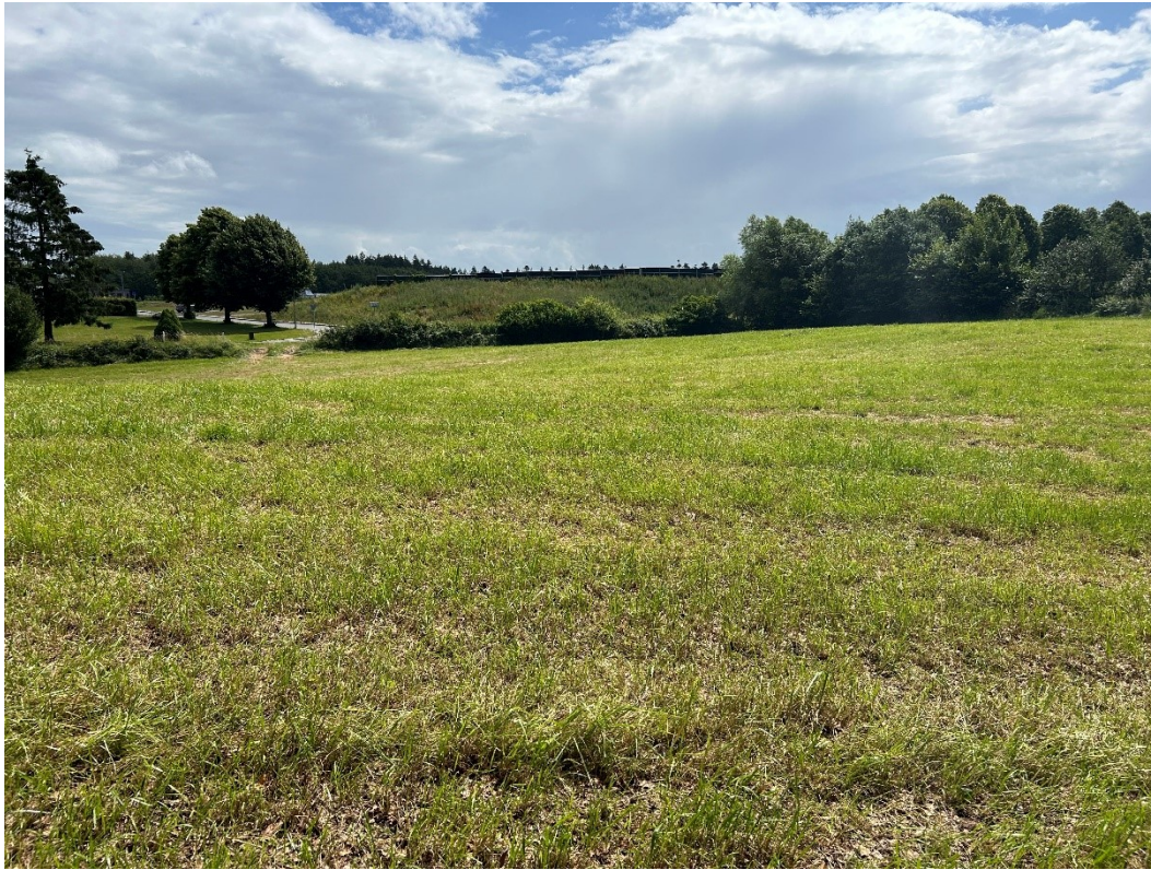
Billede 8 Billede taget fra vest mod øst. Her ses støjvolden med støjskærm.