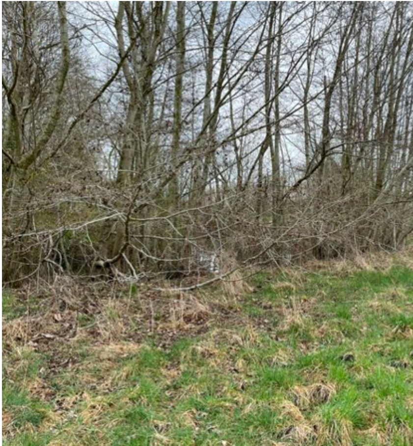
Billede 3 rødæl bevoksningen langs søen.