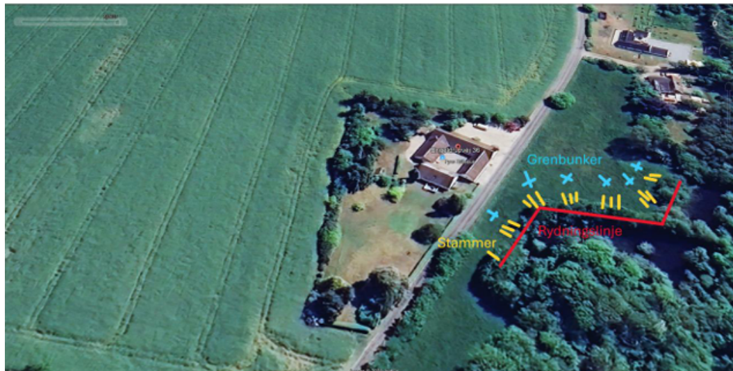
Billede 2. oversigt over arbejdets omfang.

Formålet med skovningen er at åbne op mod søens ene side for at forbedre forholdene. Enkelte bevaringsværdige træer vil blive skånet. Det fældede materiale oplægges med stammer og grene adskilt (billede 2).